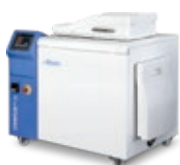
STERIPLUS™ 20 2/5 kg/h

Une gamme complète pour le traitement des DASRI.