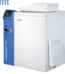
STERIPLUS™ 80 8/20 kg/h