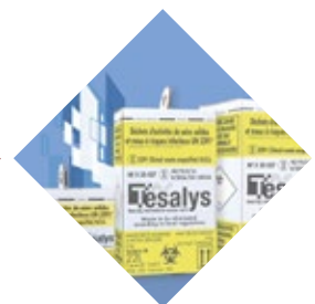
TESABOX Conteneurs en cartons pour DASRI