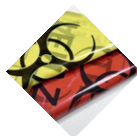
TESABAG Bolsas autoclavables con marca de riesgo biológico