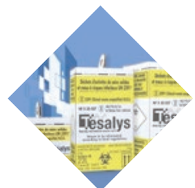
TESABOX Cajas de cartón para residuos biológicos peligrosos