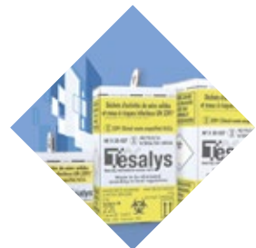
TESABOX Conteneurs en cartons pour DASRI