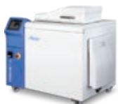
STERIPLUS™ 20 2/5 kg/h