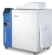
STERIPLUS™ 40 4/10 kg/h