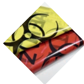
TESABAG Sacs pour DASRI autoclavables