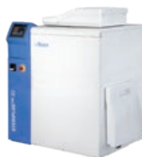
STERIPLUS™ 80 8/20 kg/h